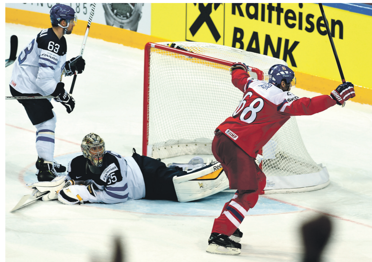
Na mistrovství světa nezazářil jen Jaromír Jágr, ale také čeští fanoušci i organizátoři turnaje

Rekordní počet diváků, rekordní zisk. Letošní mistrovství světa v Česku nebylo jen o úchvatném čtvrtfinálovém utkání českého týmu s výběrem Finska, který režíroval nejužitečnější hráč turnaje Jaromír Jágr, ale také o vynikajícím zvládnutí organizace turnaje. Šampionát přinesl nečekaný zisk ve výši 450 milionů korun, z nichž většinu prostředků hodlá Český svaz ledního hokeje (ČSLH) investovat do mládeže.