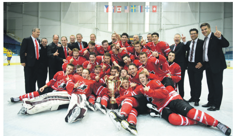
Mladí Kanadčané slaví triumf na Memoriálu Ivana Hlinky