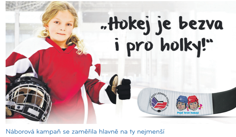
Náborová kampaň se zaměřila hlavně na ty nejmenší

a to například spoluprací s festivalem sportu s názvem Sportáček. Letošní projekt zahrnuje pět jednodenních akcí v krajských městech – Zlíně (29. května), Českých Budějovicích (29. srpna), Praze (5. září), Brně (12. září) a v Plzni (19. září). Sportáček se od jiných podobných festivalů sportu pro děti liší mimo jiné tím, že se zaměřuje čistě na sport a in-