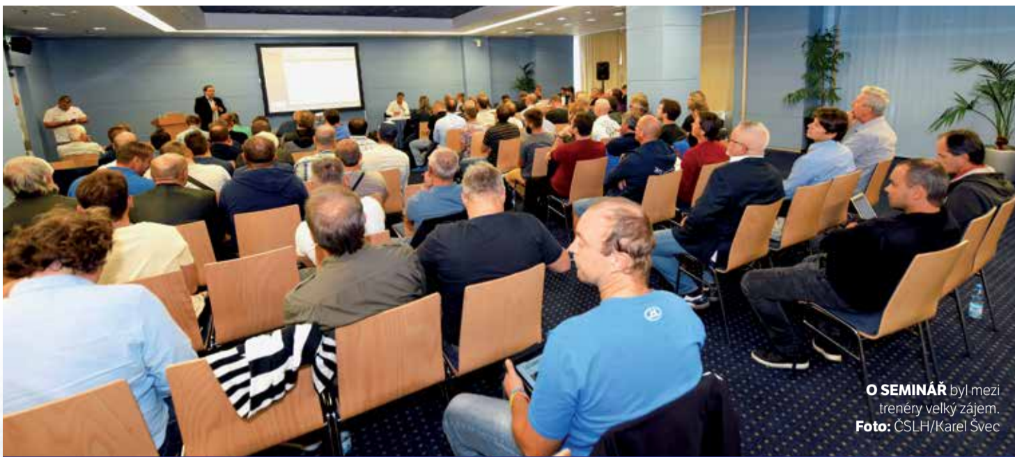
O SEMINÁŘ byl mezi trenéry velký zájem.

Správné odpovědi: 1b, 2c, 3c, 4b, 5a, 6a