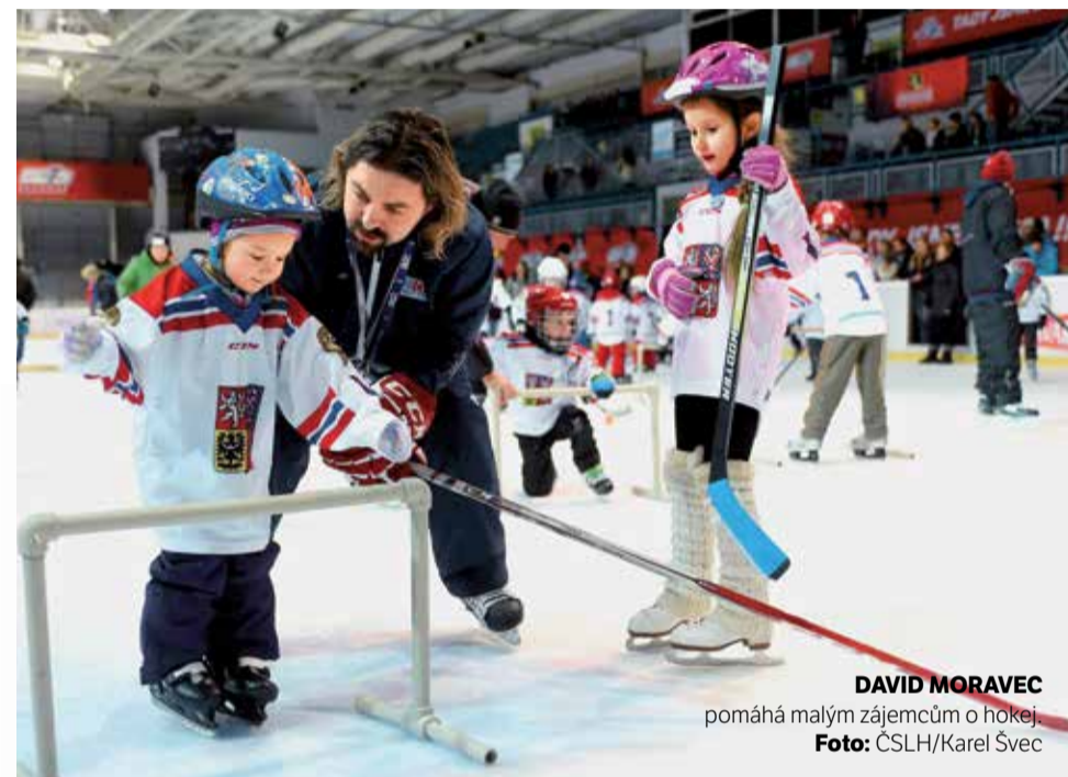
DAVID MORAVEC pomáhá malým zájemcům o hokej.

Je olympijským vítězem, rozhodl finále MS v roce 2001. A na slavný zlatý gól se Davida Moravce dodnes ptají i děti, kterým i tentokrát pomáhal s prvními krůčky na ledě v rámci úspěšné náborové akce Týden hokeje.