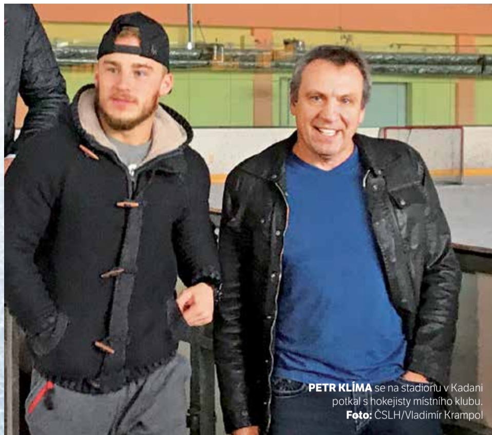
PETR KLÍMA se na stadionu v Kadani potkal s hokejisty místního klubu.

V roce 1985 pak emigroval a v Detroitu začal hrát nejlepší soutěž na světě. Prošel i Edmonto-