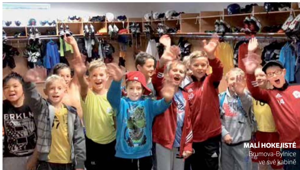
MALÍ HOKEJISTÉ Brumova-Bylnice ve své kabině

žer známý jako skatemill. Využívat mohou i služeb fyzioterapeuta, gymnastického trenéra a starším klukům je k ruce také mentální kouč.