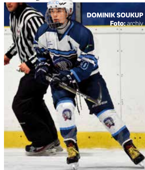
DOMINIK SOUKUP