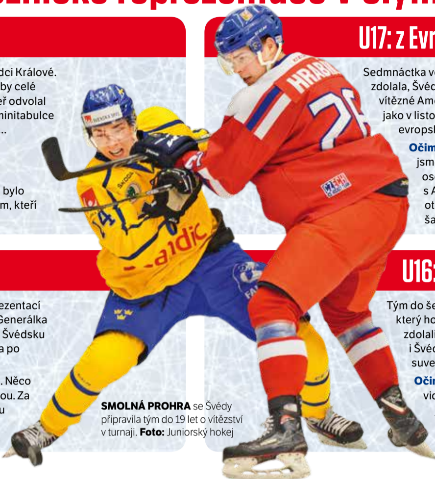
SMOLNÁ PROHRA se Švédy připravila tým do 19 let o vítězství v turnaji.