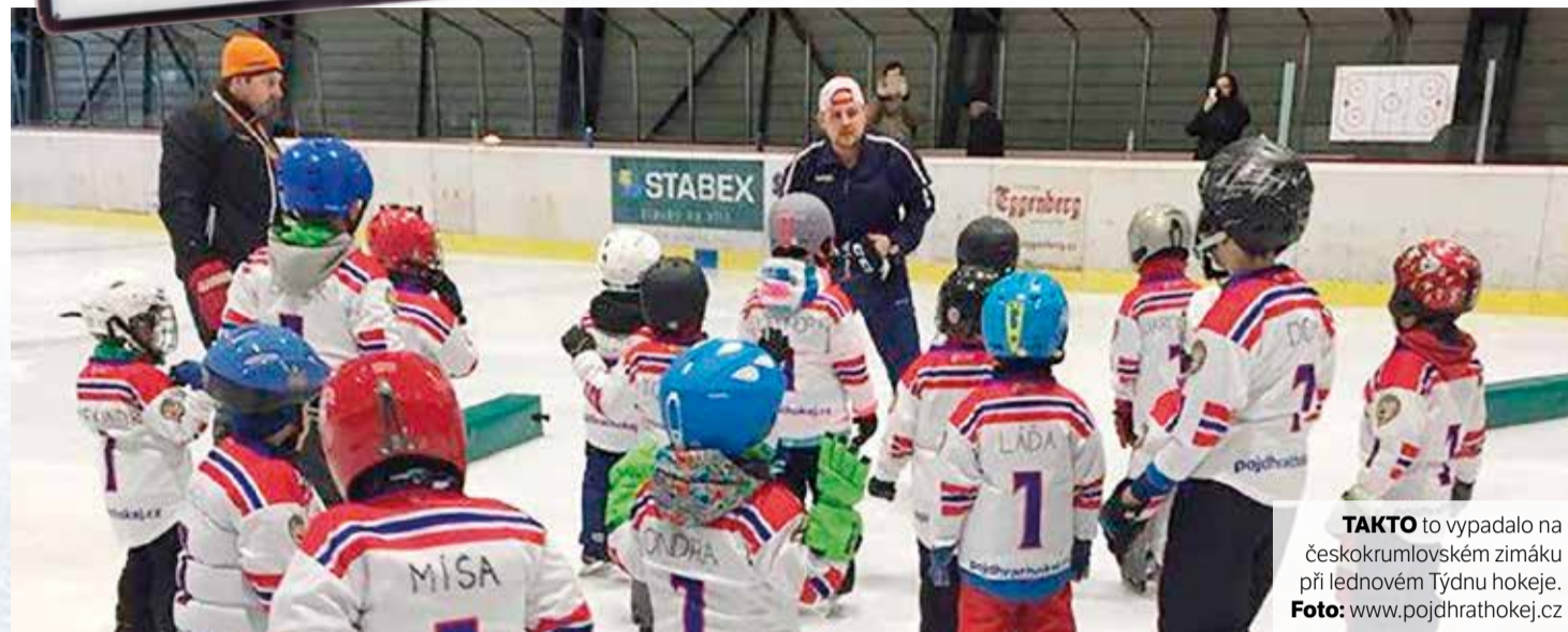
TAKTO to vypadalo na českokrumlovském zimáku při lednovém Týdnu hokeje.

Správné odpovědi: 1b, 2b, 3c, 4b, 5a, 6b