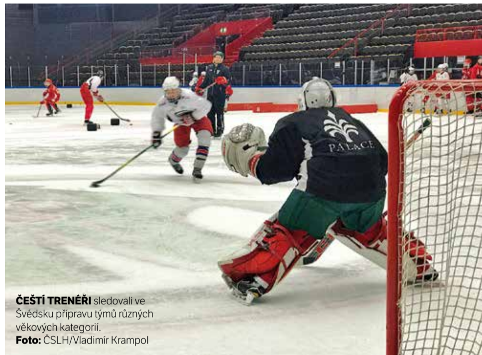
ČEŠTÍ TRENÉŘI sledovali ve Švédsku přípravu týmů různých věkových kategorií.

Přejíždíme do Göteborgu, kde nás čeká místní Frölunda. Nečekal jsem, že přijetí v tomto velkém klubu bude tak vřelá a výměna zkušeností tak otevřená. Vidíme trénink hokejistů v kategorii U14, U15. Na začátku opět volná asi