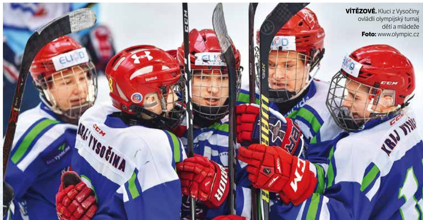
VÍTĚZOVÉ. Kluci z Vysočiny ovládli olympijský turnaj dětí a mládeže

Slavnostní ceremoniál, zapálení ohně, urputné, ale férové bitvy jako pod opravdovými pěti kruhy. Olympiáda dětí a mládeže přinesla parádní sportovní podívanou a hokejový turnaj patřil k jejím ozdobám.