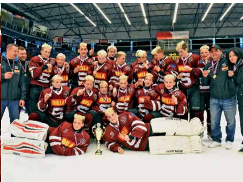
SPARTÁNSKÁ DÉJÁ VU aneb Po mladších dorostencích slavili v Hradci i jejich kolegové z 8. třídy.