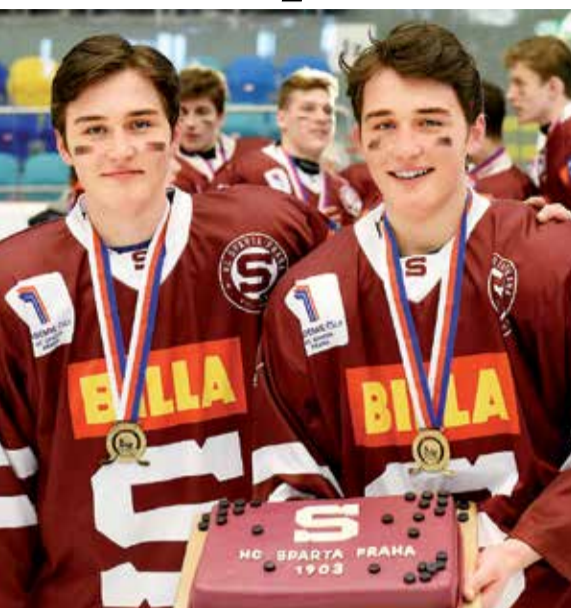
PRO MLADŠÍ DOROSTENCE Sparty byly sladkou odměnou nejen pohár a medaile, ale i výtečný dort.