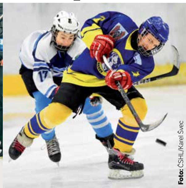
KLUCI Z PŘEROVA byli příjemným překvapením, z turnaje 8. tříd si nakonec odvezli bronz.

Triumfem hokejistů Plzně skončila NOEN Extraliga staršího dorostu. O věkovou kategorii niž brali titul mladší dorostenci Sparty a o double pro pražský klub se postarali jejich následovníci z 8. tříd.