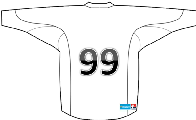
Náhled umístění loga Tipsport ELH na zadní straně dresu

5.10. Každý Klub je povinen předložit řediteli ELH nejpozději do 31. 8. 2020, v případě zvláštních edicí dresů pak 20 dní před konáním utkání, ke kterému má Klub v takových dresech nastoupit, ke schválení design dresů, v nichž má Klub nastupovat v utkáních Tipsport ELH, a to v elektronickém formátu pdf. V případě nedodržení podmínek daných čl. 5.5. tohoto Herního řádu, či v případě nedostatečného kontrastu čísel na zadní straně dresu oproti převládající barvě dresu, má ředitel ELH právo dresy pro utkání ELH neschválit.