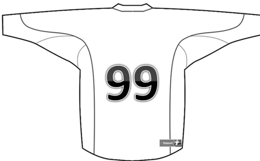
Náhled umístění loga Tipsport ELH na zadní straně dresu

5.9. Kluby jsou pro účely utkání Tipsport ELH povinny umístit na pravou spodní část zadní strany dresu logo Tipsport ELH o velikosti 10x3,5 cm. Výjimku tvoří vítězní semifinalisté I. ligy ČR, kteří v části 3b) - o udržení, resp. o postup do ELH dres opatřený logem Tipsport ELH mít nemusí.