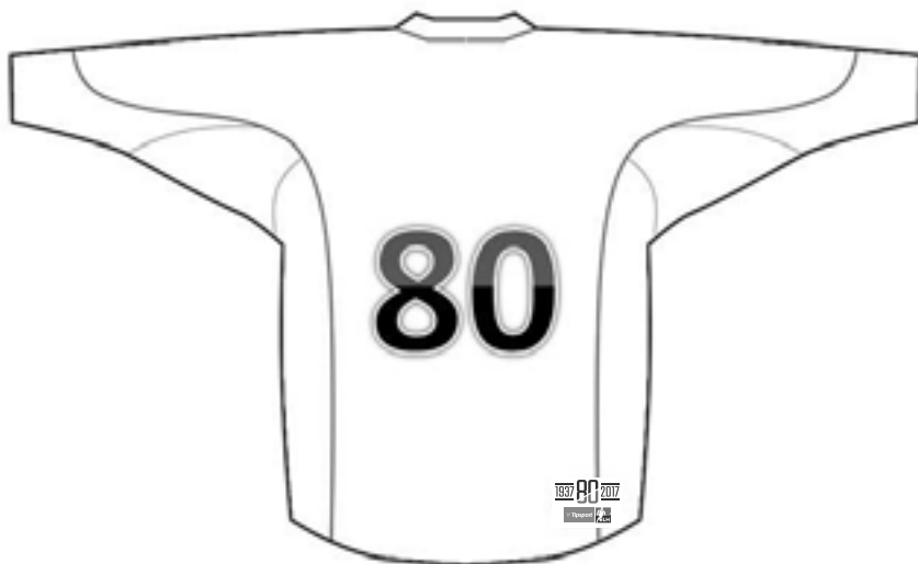
Náhled umístění loga Tipsport ELH na zadní straně dresu

5.9. Kluby jsou pro účely utkání Tipsport ELH povinny umístit na pravou spodní část zadní strany dresu logo Tipsport ELH o velikosti 10x7 cm. Výjimku tvoří vítězní semifinalisté I. ligy ČR, kteří v části 3b) - o udržení, resp. o postup do ELH dres opatřený logem Tipsport ELH mít nemusí.