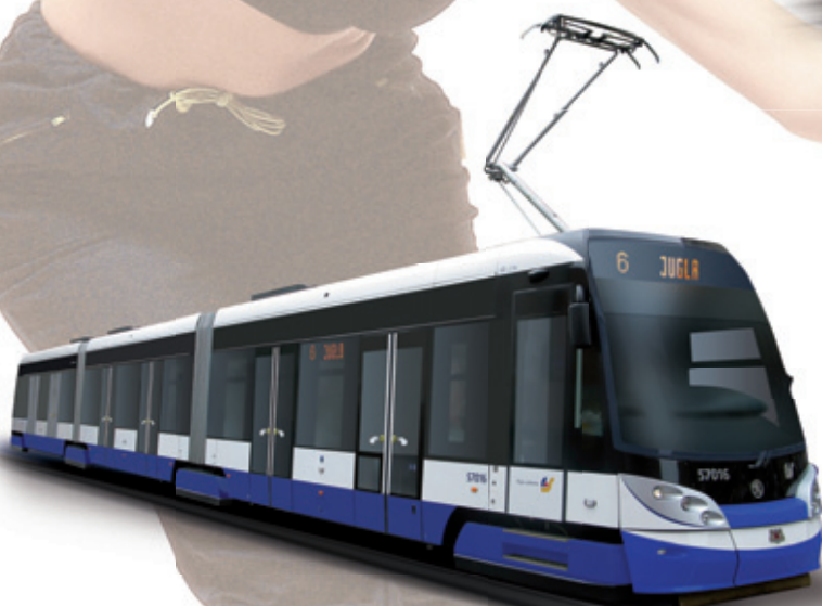
LOW-FLOOR TRAMCAR FORCITY FOR RIGA