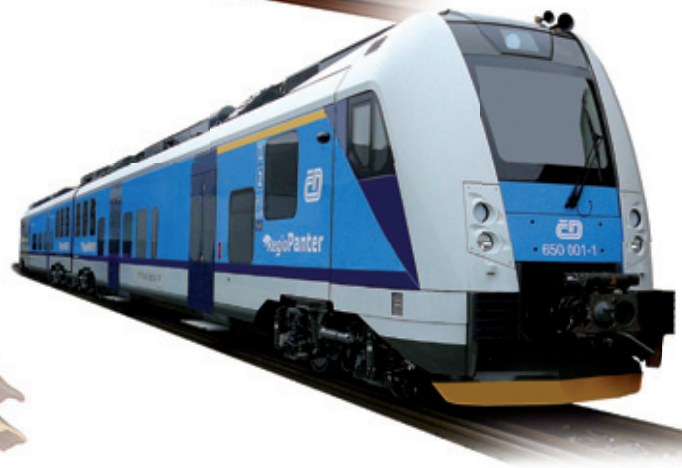
ELECTRIC MULTIPLE UNIT REGIOPANTER FOR CZECH RAILWAYS

ŠKODA VAGONKA a.s. Phone: +420 597 477 111 Fax: +420 597 477 190 E-mail: vagonka@skoda.cz www.skoda.cz