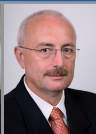
↑ Oldřich Ryšavý

účastníci ocení přátelskost a pohostinnost pořadatelů. Jako prezident IIHF bych chtěl poděkovat Českému svazu ledního hokeje za převzetí pořadatelství a popřát všem hráčům hodně štěstí nejen na tomto turnaji, ale i v jejich budoucí hokejové kariéře.