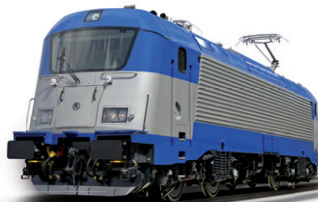
ELECTRIC LOCOMOTIVE ŠKODA 109 E FOR CZECH RAILWAYS

Traditional European manufacturer of rail vehicles locomotives, tramcars, metro trainsets, multiple units, passenger coaches