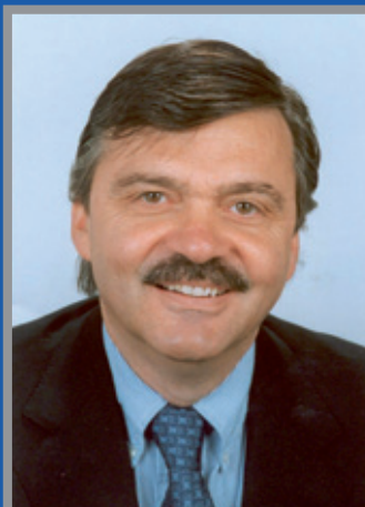
↑ René Fasel

Jsem moc rád, že jste zavítali na náš zimní stadion, který dostal tu čest hostit několik zápasů mistrovství svě-