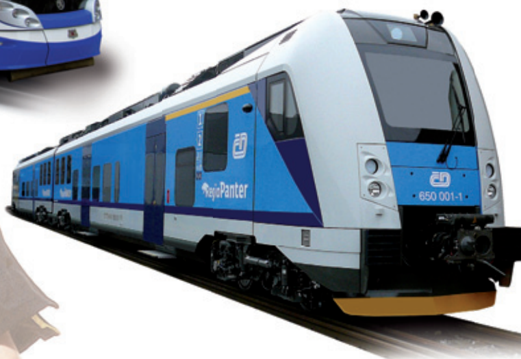
ELECTRIC MULTIPLE UNIT REGIOPANTER FOR CZECH RAILWAYS

Phone: +420 37818 6666 Fax: +420 37818 6097 E-mail: transportation@skoda.cz www.skoda.cz