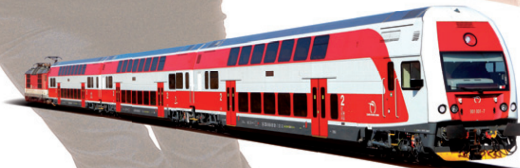
PUSH-PULL TRAIN FOR ZSSK