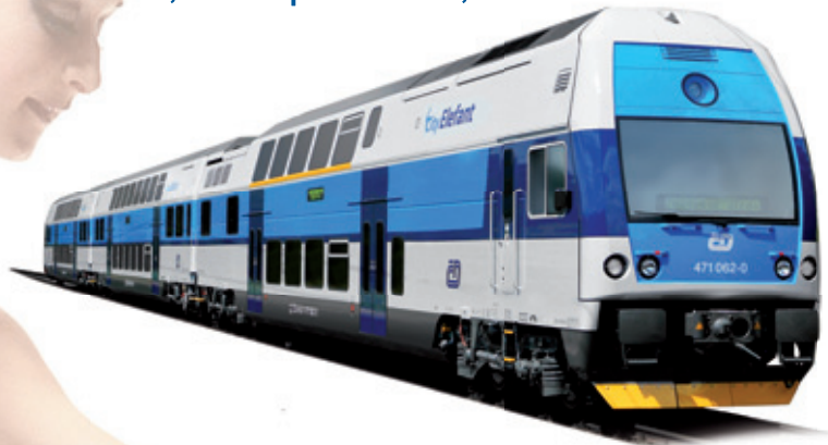
ELECTRIC DOUBLE-DECK UNIT CITYELEFANT FOR CZECH RAILWAYS

Traditional European manufacturer of rail vehicles locomotives, tramcars, metro trainsets, multiple units, passenger coaches